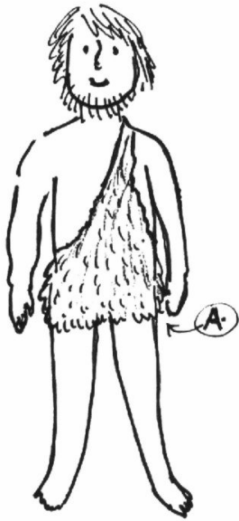
für die Herrn Kollegen

Bei Bestellungen wenden Sie sich bitte an die Kultusministerin, die meisten Parteien oder an Ihren örtlichen Arzt oder Apotheker.