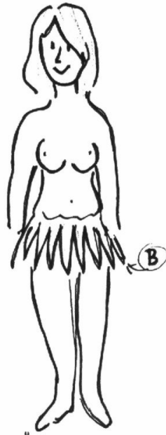
für die Damen Kolleginnen

(A) = Wams, Material * Katze * für Allergiker auch in Plüschimitation